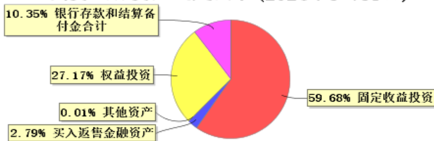
投资组合资产配置图表 (2024年3月31日)

● 固定收益投资 ● 买入返售金融资产 ● 其他资产 ● 权益投资 ● 银行存款和结算备付金合计