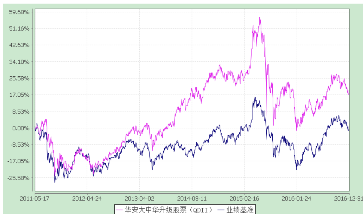
华安大中华升级股票型证券投资基金 份额累计净值增长率与业绩比较基准收益率历史走势对比图 (2011 年 5 月 17 日至 2016 年 12 月 31 日)

注：根据《华安大中华升级股票型证券投资基金基金合同》规定，本基金建仓期不超过 6 个月。截至本报告期末，本基金的投资组合比例已符合基金合同第十四部分“基金的投资”中投资范围、投资限制的有关约定。